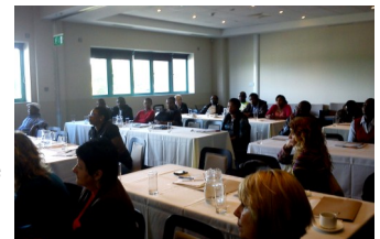
Siehe oben ein Foto des gut besuchten Symposiums in Limerick, Irland am 3. Oktober 2012

waren mehrere ehrenvolle Universitätsprofessoren und Experten auf dem Gebiet der sozialen Gerechtigkeit, kulturellen Vielfalt, Bildung, Recht, Führung und nachhaltige Entwicklung aus Irland und weiteren europäischen Partnerländern.