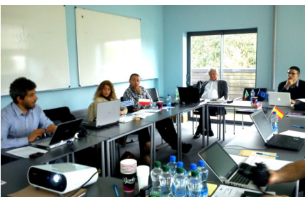
Die SONETOR Partnerschaft diskutiert und entscheidet über die Unterlagen und Inhalte im Meeting in Limerick, Irland.