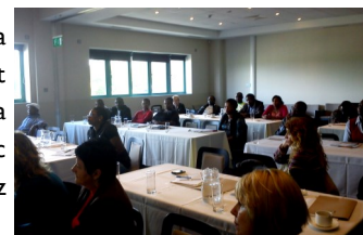
Powyżej fotografia przedstawiająca duże zainteresowanie sympozjum w Limerick (Irlandia), 3 października 2012 r.

się kilku znanych profesorów uniwersyteckich i ekspertów w dziedzinie sprawiedliwości społecznej, różnorodności kulturowej, edukacji, prawa, przywództwa i zrównoważonego rozwoju w Irlandii i innych europejskich krajach partnerskich.