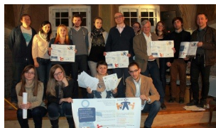
Polish cultural mediators were introduced to the SONETOR project and platform.