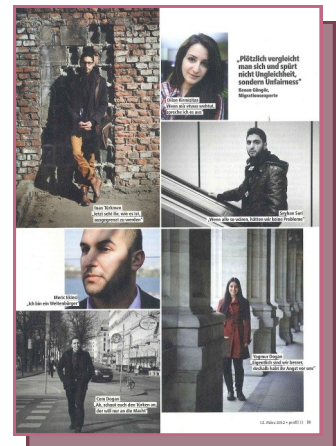
"Assortiert" ist der Titel dieses Artikels im Nachrichtenmagazin "Profil", der hier zitiert wird.

Der Forum Bereich der SONETOR Plattform bietet Nutzern die Möglichkeit Themen zu diskutieren. Dieses Feature nutzen im Moment viele Personen aktiv.