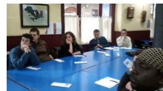
Interessante Diskussionen am ersten SONETOR Workshop in Spanien.

Meinungs- und Erfahrungsaustausch in Bezug auf die Integration und die damit verbundenen Probleme in den einzelnen Ländern. Die potenziellen Nutzer setzen sich für eine strenge Kontrolle und sorgfältige Moderation durch die Administratoren ein. Sie sind über Fremdenfeindlichkeit und rassistische Interventionen, die glühende Themen in diesem Bereich sind, besorgt. Die spanischen Workshop-Teilnehmenden genossen die Diskussionen und waren damit einverstanden einen Beitrag auf der Plattform mit Inhalten und Kommentaren zu leisten.